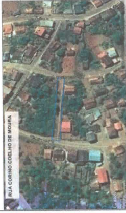
PLANTA DE SITUAÇÃO

CONVENÇÕES ———— CORTA-CORTA P. O. SERRAS ———— ALTA D. E. SERRA, T. C. A. ———— AB. B. P. 1. SERRAÇÃO P. PLAN. 1 ———— LERDA D. M. S. A. ———— SERRAS ———— 300-34-303 MA. 0225 MP. 0.14.14.98 ———— 300-34-303 15.12.13 J. 0.14.14.98